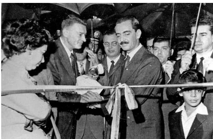
Debaixo de chuva, o governador Jânio Quadros inaugura o Zoológico

feira. Nos finais de semana, esse número cresce para 35.